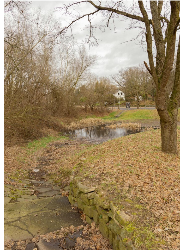
Impressie op basis van voorbeeld