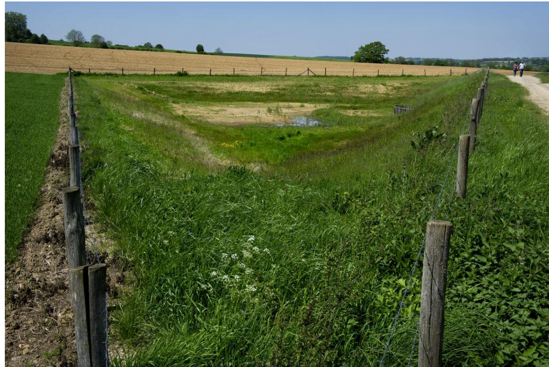
Impressie op basis van voorbeeld