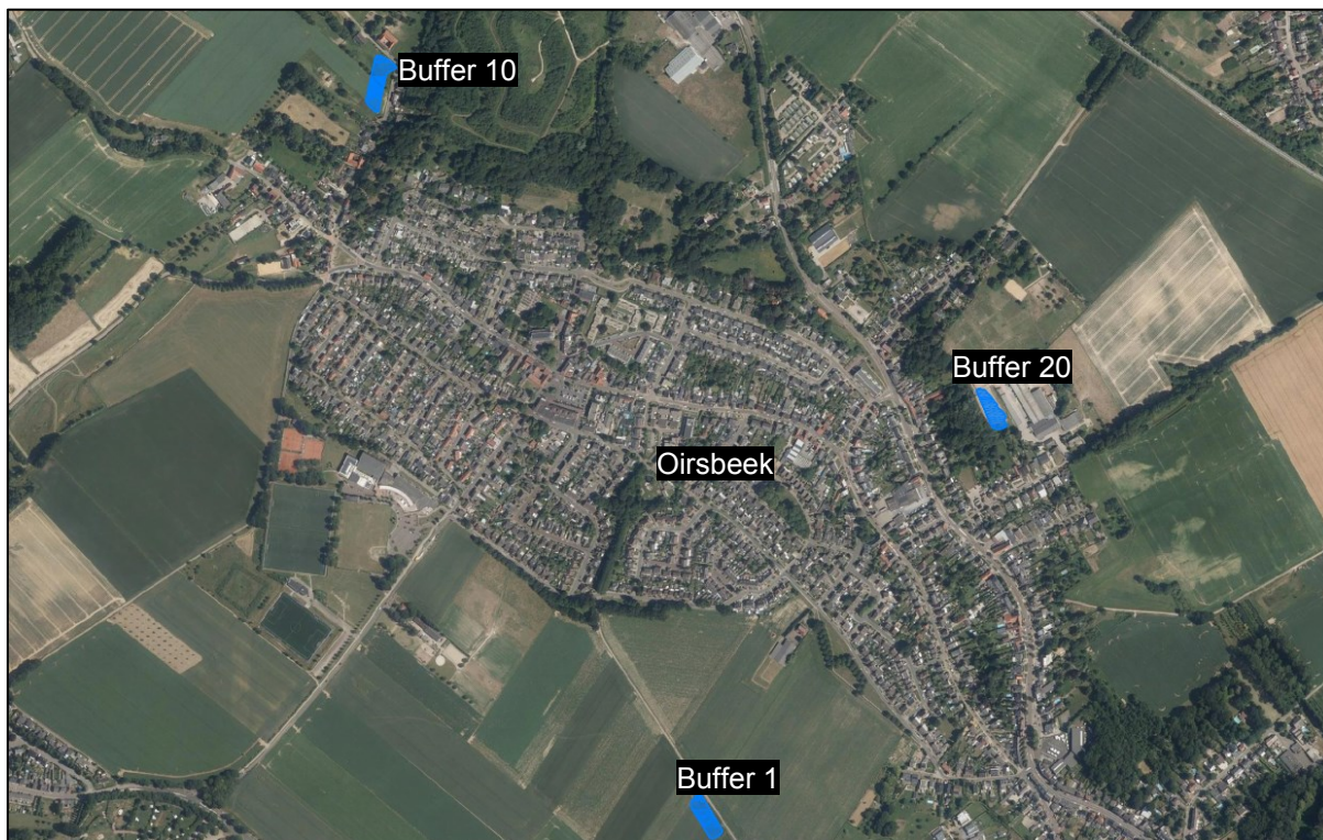
Figuur 1: Locatie projectgebied met de locaties van de aan te passen en te realiseren waterbuffers